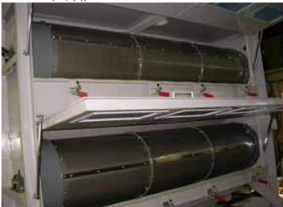
特殊スクリーン部